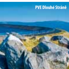
PVE Dlouhé Stráně