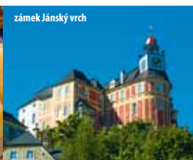
zámek Jánky vrch