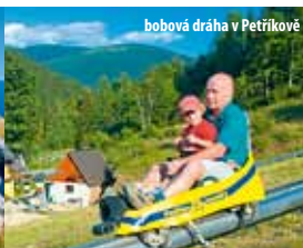
bobová dráha v Petříkově