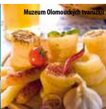
Muzeum Olomouckých tvarůžků